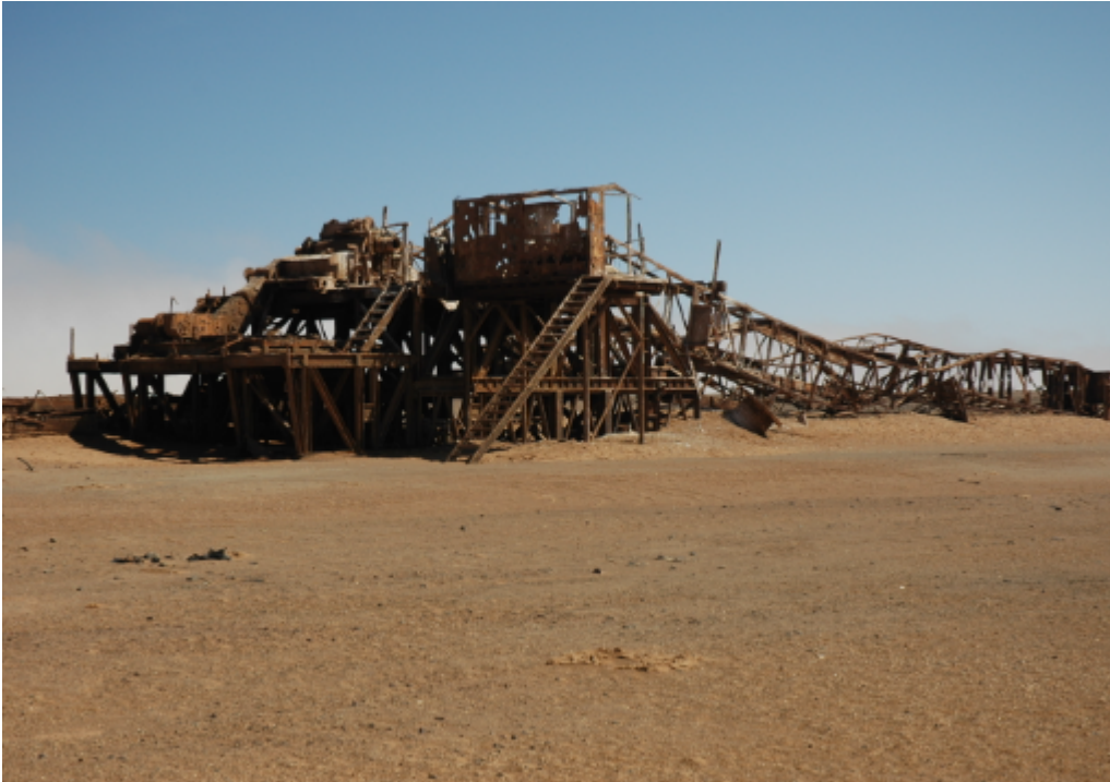
Désert de Skeleton Coast, Namibie

Le chasseur de trésors urbain a aussi le profil de quelqu'un qui est toujours à la recherche du chemin le plus court, cet utilisateur ne suit pas les itinéraires par défaut.